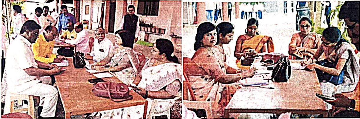
Registration desk of the conference