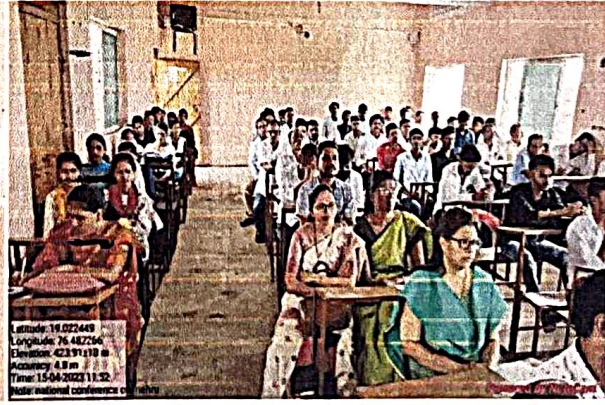
The Conference Hall with the delegate participants