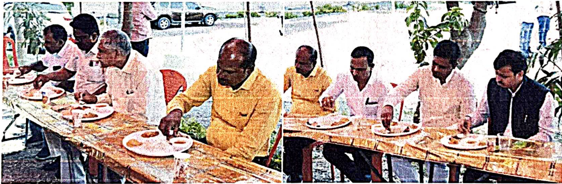
Some snaps during the Lunch

News cuttings of the conference published in various news papers