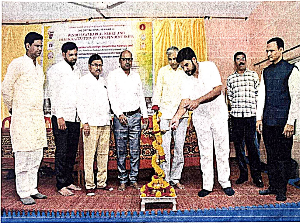
Hon. Dignitaries lighting the lamp during the Inaugural Ceremony of the One Day National Conference on Pandit Jawaharlal Nehru and Democratization of Independent India