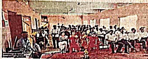
सोनपेठ येथे आयोजित राष्ट्रीय परिषदेसाठी उपस्थित संशोधक, प्राध्यापक व मान्यवर.